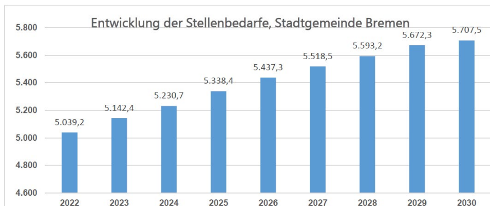
Abbildung 1: Entwicklung der VZE-Stellenbedarfe in absoluten Zahlen