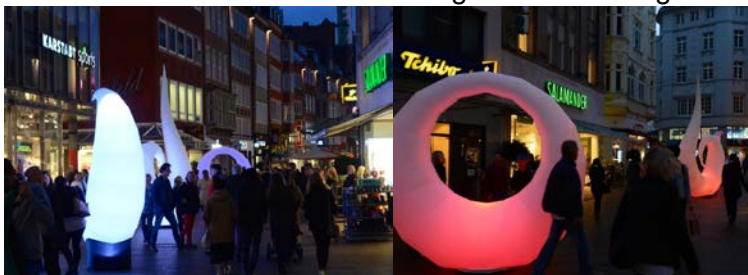
Beispiele für gemietete Beleuchtung durch Drittanbieter

Ergänzend können entsprechende Beleuchtungseinheiten zu ausgewählten Events angemietet werden. Siehe folgende Abbildung: