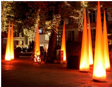
„Airlights“ der CI Bremen

Einige sog. Airlights befinden sich im Eigentum der CityInitiative Bremen Werbung e.V. (CI) und können durch diese eingesetzt werden.