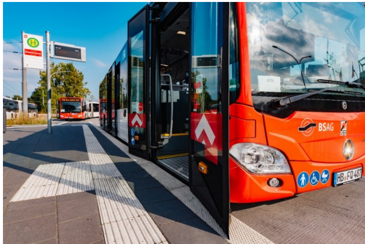
Abbildung 6: Umsteiganlage Roland-Center, Sonderbord zum niveaugleichen Einstieg und Blindenleitsystem