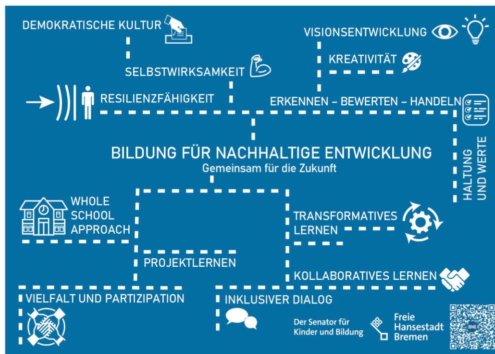
Abbildung 9: Mindmap Orientierungsrahmen Bildung für nachhaltige Entwicklung des Senators für Kinder und Bildung ( https://www.bildung.bremen.de/schulqualitat-5134 ) (© SKB)

lich und fachlich. Der Senator für Kinder und Bildung hat deshalb mit dem „Orientierungsrahmen Bildung für nachhaltige Entwicklung“ eine normative Grundlage geschaffen, wie BNE im Bremer Bildungswesen verankert werden soll.