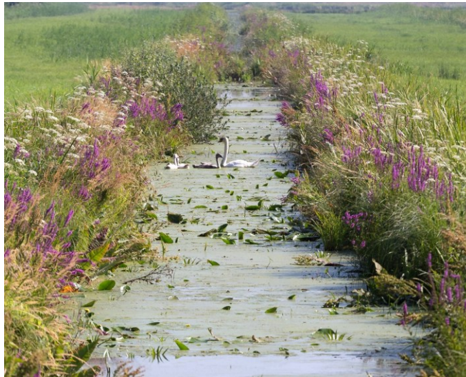
Abbildung 5: Artenreiche Hochstaudenvegetation im Bremer Graben-Grünlandgürtel

Das im Programm „EU-INTERREG North West Europe“ geförderte Projekt „PolliConnect“ unterstützt die Umsetzung des Bremischen Insektenschutzprogramms 2030 (siehe Aspekt 11.1). Gemeinsam mit Partner:innen aus Belgien, den Niederlanden, Frankreich und Irland testet das Umweltressort neue Methoden der Vernetzung von Lebensräumen, um die Populationen wild lebender Bestäubungsinsekten zu fördern. Dabei geht es u. a. um die Etablierung arten- und blütenreicher Hochstauden (siehe Abbildung 5).