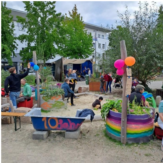
Abbildung 2: Gemeinschaftsgarten Lucie: „Garten für alle“ im Stadtteil Neustadt

Das Umweltressort fördert zudem ein landesweites Projekt des Fördervereins Umwelt Bildung Bremen e. V. Diese „ Koordinierungsstelle Umwelt Bildung Bremen “ vernetzt private und öffentliche Einrichtungen, Personen und Aktivitäten, betreibt Öffentlichkeitsarbeit, entwickelt und ermöglicht Qualifizierungs- sowie Weiterbildungsangebote für Schulen und Kindergärten. Überdies betreut und berät sie gemeinnützige Vereine bei Antragstellung, Umsetzung und Abwicklung von Umweltbildungsprojekten.