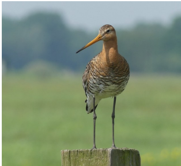
Abbildung 4: Uferschnepfe überwacht Küken im Bremer Blockland