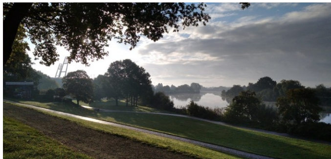
Abbildung 3: Blick vom Osterdeich auf die Weser

Auch die Anlagen zur Be- und Entwässerung sollen im Rahmen der strategischen Klimaanpassung betrachtet werden. Hierzu wird derzeit gemeinsam mit Niedersachsen der „Generalplan Klimafolgenanpassung Siel- und Schöpfwerksgebiete“ erstellt. Dieser soll analog zum Generalplan Küstenschutz die Bedarfe zur Ertüchtigung an den bremischen Sielen und Schöpfwerken erfassen. Auch hier erfolgen zunächst eine Bestandsaufnahme der Anlagen und dann eine Analyse hinsichtlich der sich klimawandelbedingt ändernden Randbedingungen, wie beispielsweise der erhöhte Meeresspiegel oder die Intensität und Dauer von Niederschlagsereignissen.