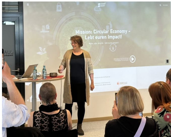
Abbildung 10: Wirtschaftsstaatsrätin Frese eröffnet Crowdfunding „Mission: Circular Economy“