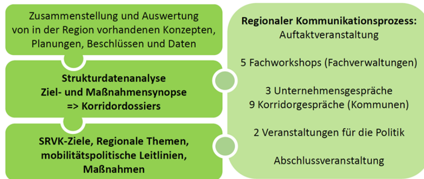
Abbildung 7: Struktur- und Erarbeitungsprozess SRVK

Mit dem im April 2025 verabschiedeten Bericht „ Stadtregionales Verkehrskonzept (SRVK) – Klimafreundlich zur Arbeit “ legen die drei Partner Freie Hansestadt Bremen, Zweckverband Verkehrsverbund Bremen/Niedersachsen und Kommunalverband Niedersachsen/Bremen e. V. ein regional abgestimmtes Konzept vor. Die kooperative Erarbeitung des Konzepts erfolgte unter Einbindung sowohl der Expertise aus Fachverwaltungen als auch der Politik.