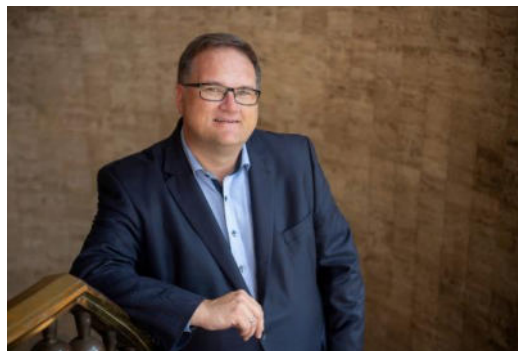
Björn Fecker, Senator für Finanzen

Die wirtschaftliche Entwicklung bleibt herausfordernd. Bremen verzeichnet einen leichten Rückgang des Bruttoinlandsprodukts und eine höhere Arbeitslosenquote. Dennoch zeigt sich, dass die Wirtschaftskraft je Einwohner im bundesweiten Vergleich weiterhin hoch ist und Bremen seine Position behaupten kann.