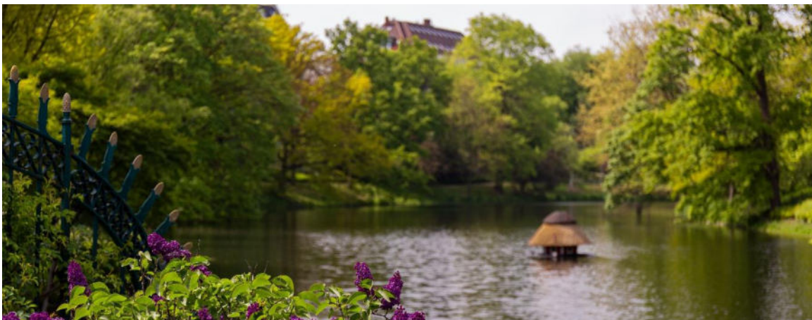
Wallanlagen in Bremen

Durch die seit 2021 getrennte Ermittlung der doppelten Jahresergebnisse je Gebietskörperschaft werden die bis 2020 neutral betrachteten haushaltstechnischen Verrechnungen zwischen den Gebietskörperschaften in Rechnung gestellt und als Erträge und Aufwendungen in der Erfolgsrechnung ausgewiesen. Mit rd. 2.392 Mio. Euro Erträgen und rd. 135 Mio. Euro Aufwendungen schlug dieser Effekt im Verwaltungs- und Jahresergebnis der Stadtgemeinde Bremen mit einem Plus von rd. 2.257 Mio. Euro zu Buche. Dem entspricht das im doppelten Jahresabschluss des Landes ausgewiesene Defizit von rd. 2.257 Mio. Euro. Über beide Gebietskörperschaften gleichen sich Erträge und Aufwendungen nahezu aus.