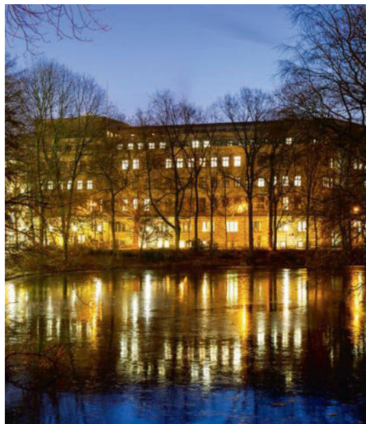
Blick über die Wallanlagen auf das Haus des Reichs

Bei den in Tabelle 6 abgebildeten Gesamteinnahmen des Stadtstaates in Höhe von rd. 10 Mio. Euro handelt es sich um Rückzahlungen von Projekt- und Fördermitteln, die in den Haushalten auf Landes- und städtischer Ebene erzielt wurden, darunter rd. 9 Mio. Euro im Kontext von ÖPNV-Hilfen des Landes. Auch bei den Einnahmen des Vorjahres von 7 Mio. Euro handelte es sich vor allem um derart gelagerte Rückzahlungen. Weiterhin waren noch Zuflüsse vom Bund in Höhe von 2,6 Mio. Euro für den Betrieb von Impfzentren und für das Förderprogramm für Corona-Überbrückungshilfen zu verzeichnen. Im Jahr 2024 erfolgten keine Einnahmen von Seiten des Bundes mehr.