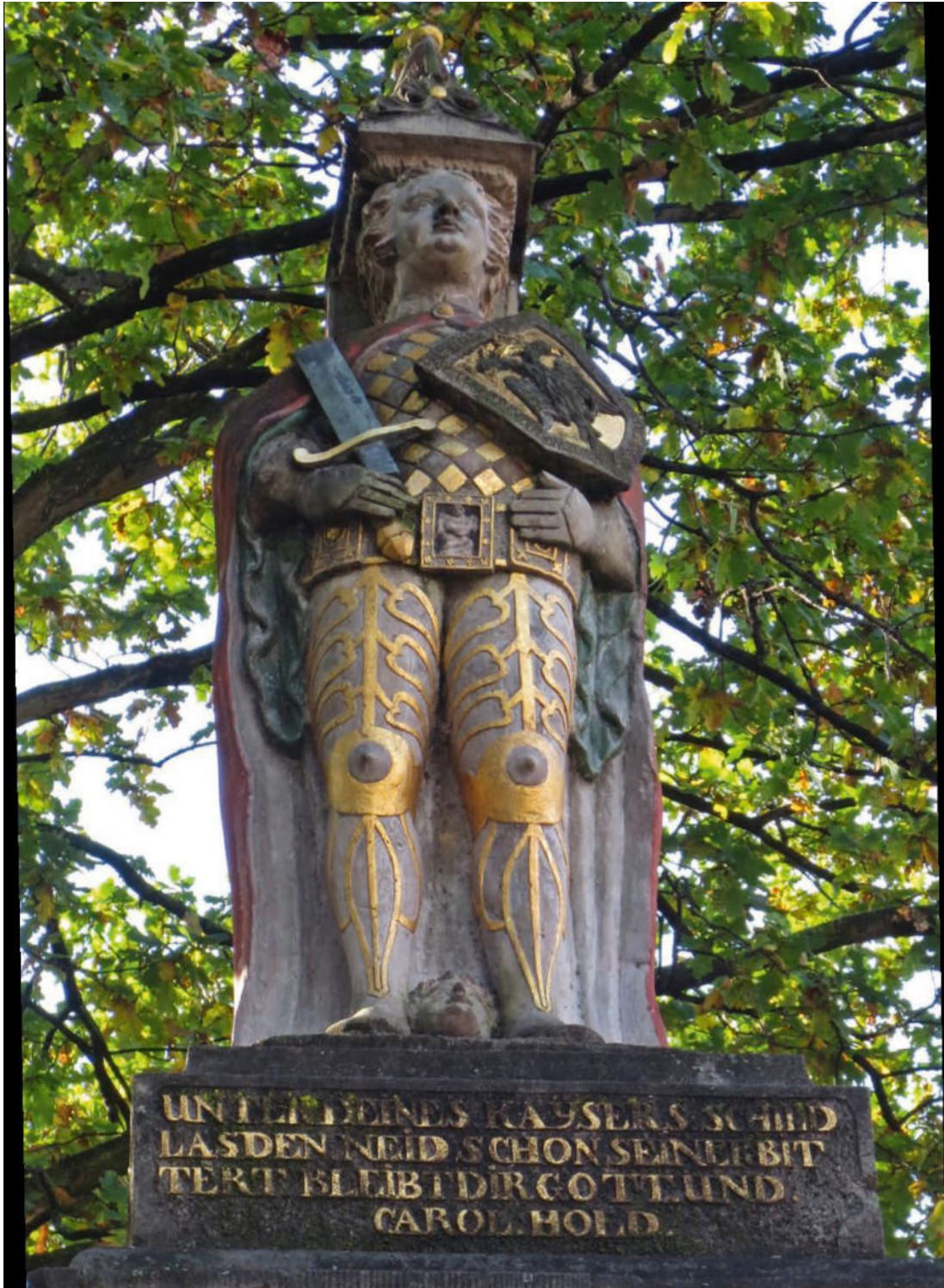
Kleiner Roland in der Bremer Neustadt