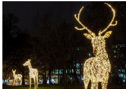
Wallanlagen in Bremen

Der Jahresfehlbetrag errechnet sich aus dem Verwaltungs- und dem Finanzergebnis (zzgl. Steuern) und erreicht 2024 in der Stadtgemeinde Bremen ein Minus von 302,67 Mio. Euro.