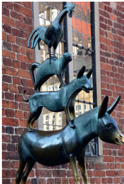
Die Bremer Stadtmusikanten

Die Finanzierung der coronabedingten Belastungen erfolgt durch eine Kreditfinanzierung und Tilgung ab 2028 über die nächsten 30 Jahre.