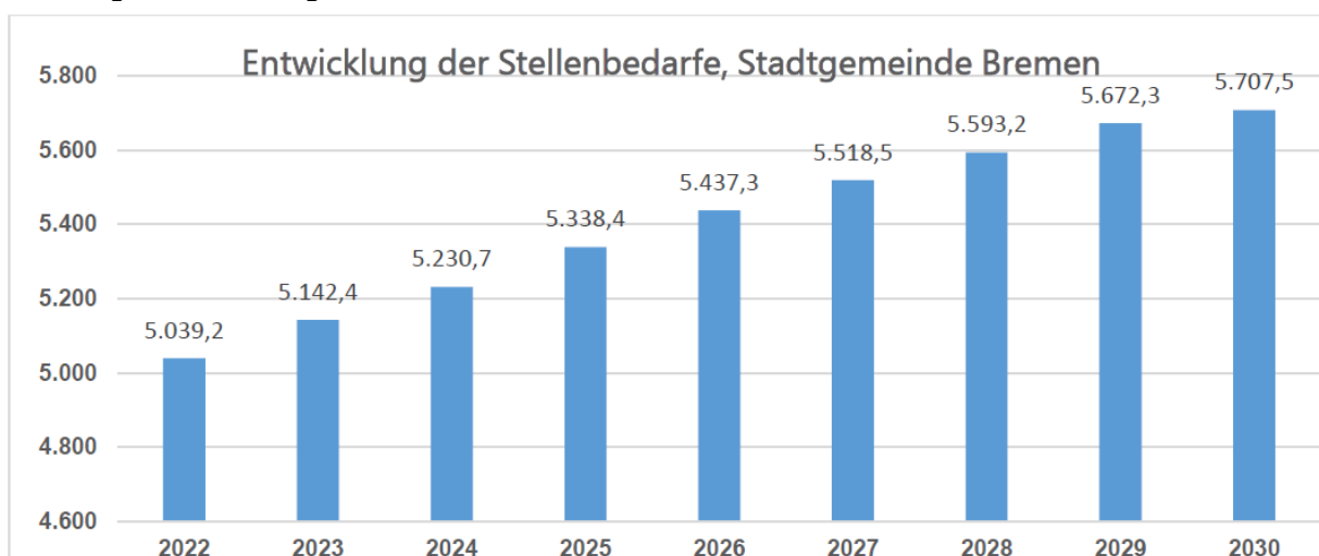
Abbildung 1: Entwicklung der VZE-Stellenbedarfe in absoluten Zahlen